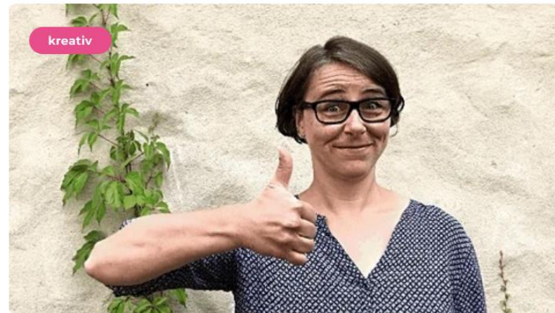
2 Sekunden Gif